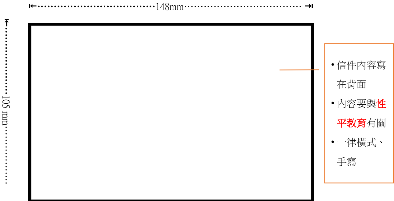
(背面) 明信片背面可加上適當美編